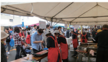
飲食物販売ブース