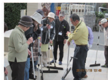
清掃講習会の様子

講習・研修会の充実や満足度調査により就業の質を向上させ、また、会員目線・お客様目線により利便性を向上させることにより、就業機会を拡大します。