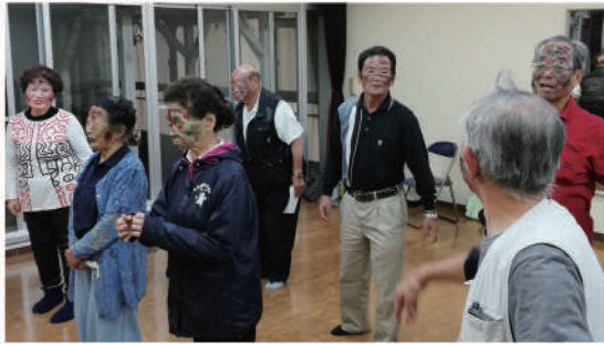
コーラス同好会(ゾンビ)