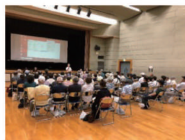
地域ブロック懇談会の様子