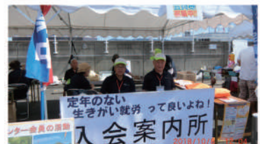
新入会の受付ブース