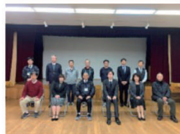
策定委員会集合写真