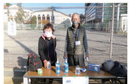
グラウンドゴルフ 受付にて検温・消毒