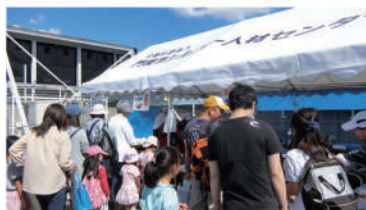
世代間交流コーナー