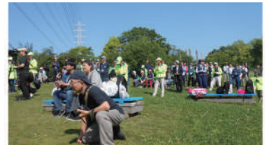
ステージに魅入る来場者の様子