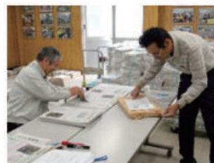
広報紙の配布準備