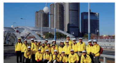
門真市シルバーチーム