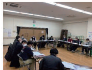
中長期計画策定委員 会議の様子

『高齢者が社会の担い手として生涯現役で活躍することの出来る幸せな長寿社会を創造』するための門真市シルバー人材センターの事業の基本計画のことで、当センターでは設立50周年に向けて令和3年度から10年間の基本計画を策定しています。