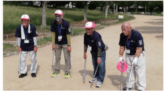
ボランティア清掃(ゾンビ)