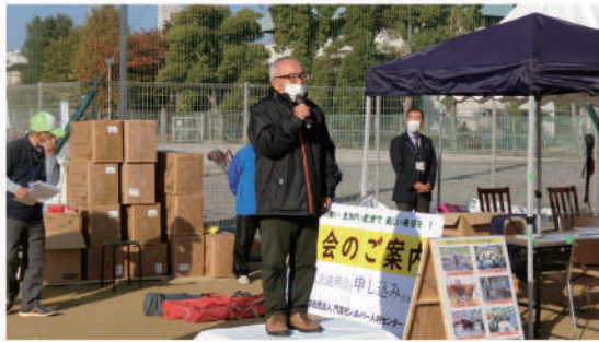
開会式(理事長挨拶)

グラウンドゴルフ同好会『グラウンドゴルフ大会』11月14日(土)@門真市立旧第六中学校運動広場にて