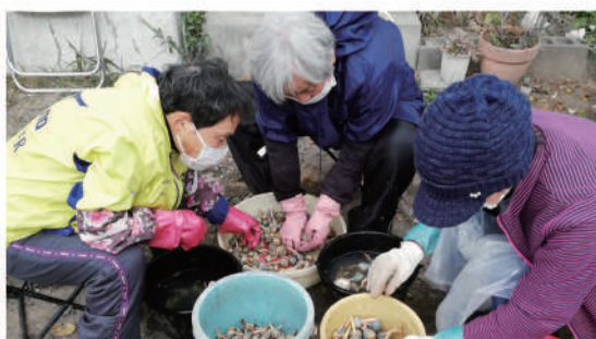
収穫物(くわい)の洗い