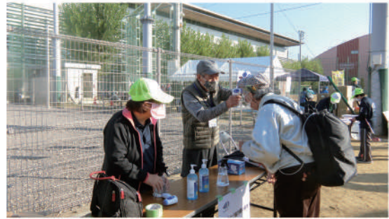
参加者の検温・消毒