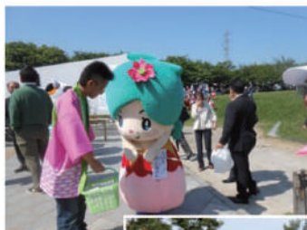
「シルバーれんちゃん」の活動(上)とボランティア清掃によるPRの様子

センター主催のイベントや、他団体のイベントへの協力・協賛を通じてシルバー人材センター事業の普及を行います。