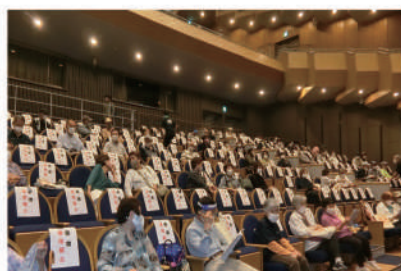
会場でもソーシャルディスタンス確保をお願い