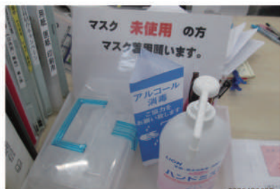
マスク・消毒の徹底