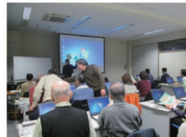
パソコン同好会による市民向けパソコン講座

各種のイベントやITの活用、特典の充実や相談会の実施等、活躍する仲間の増える環境を整え、魅力的なセンターを作ります。