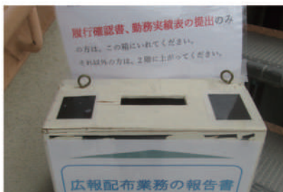
対面を避けて報告書の受け取り