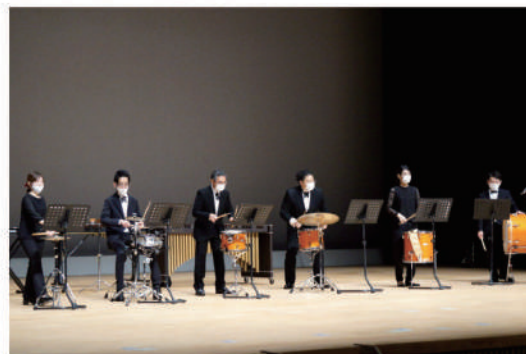
パナソニックSL吹奏楽団