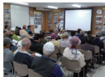
門真警察署による自転車安全講習会の様子