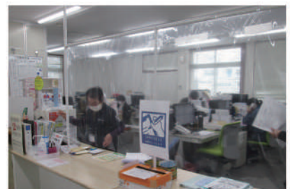
ビニールカーテンの設置