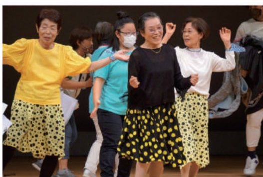
ファッションショー